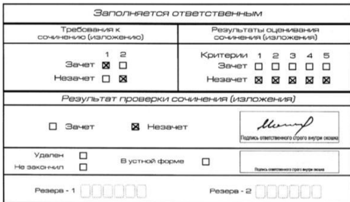
Рис. 2 Область для оценки работы

Если итоговое сочинение (изложение) соответствует требованию № 1 и требованию № 2, то эксперт выставляет «зачет» за выполнение требования № 1 и требования № 2. Указанное итоговое сочинение (изложение) оценивается по критериям.