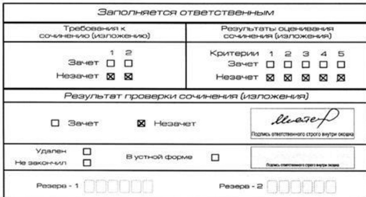
Рис. 1 Область для оценки работы

В клетки по всем требованиям (№ 1 и № 2) и критериям оценивания выставляется «незачет». В поле «Результат проверки сочинения (изложения)» ставится «незачет» (см. рис.1).