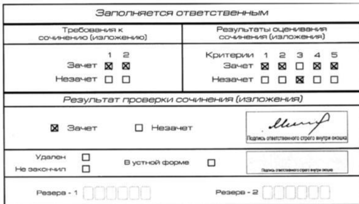
Рис 3 Область для оценки работы

Во всех остальных случаях итоговое сочинение (изложение) проверяется по всем пяти критериям и оценивается по системе «зачет»/«незачет» (например, нельзя не проверять работу по критериям К4 и К5, если выпускник получил зачет на основании зачетов по критериям К1, К2, К3) (см. рис. 3).