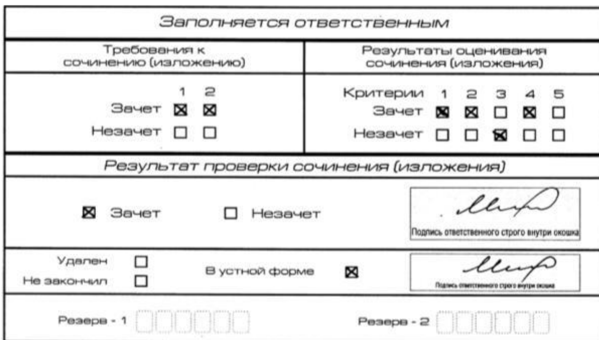
Рис. 4 Область для оценки работы в устной форме

Для получения «зачета» за итоговое сочинение (изложение) необходимо получить «зачет» по критериям № 1 и № 2, а также дополнительно «зачет» по одному из критериев № 3 или № 4. Итоговое сочинение (изложение) в устной форме по критерию № 5 не проверяется и отметки в соответствующие поля «Критерия 5» не вносятся (остаются пустыми) (см. рис. 4).