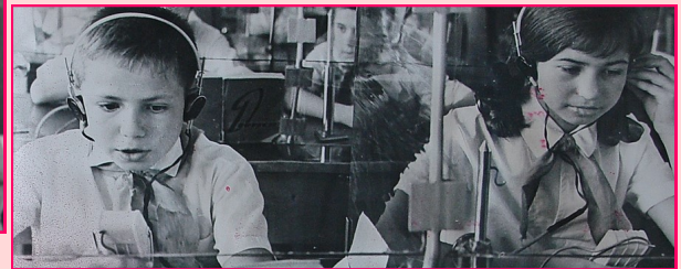
Лингафонный кабинет английского языка

Каждый второй ученик школы учился на «4» и «5». А школе было присвоено звание образцово-показательной. Она становится базовой школой Саратовского областного института усовершенствования учителей.