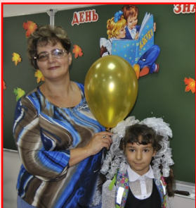
1 сентября 2016 года

И вот, через неважно сколько лет Сюда свою я дочку привела. - Я здесь найду подруг, найду друзей, Всему-всему на свете научусь. И в это день, день славный юбилея, Поздравить нашу школу я хочу.