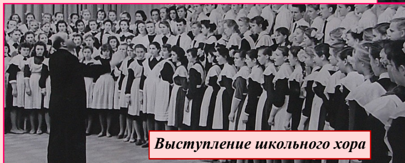
Выступление школьного хора