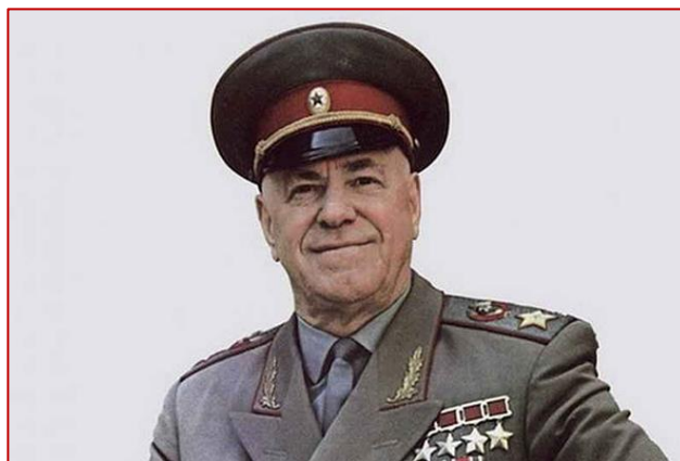
Г.К. Жуков принимает Парад Победы. 24 июня, 1941 год